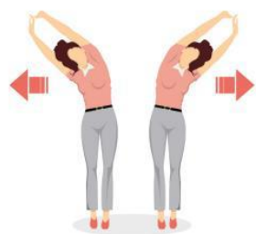
Etirement du dos